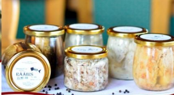
Kurista söögitaras marineeritakse oma retsepti järgi ahvenat, koha, haugi, latikat ja räabis.

Hommikuses päikesetõus sillerdav Peipsi järv annab tööd kaluritele, pakub puhkust harrastuskalameestele ja katab toidulaua mageveekaladega. Aastas püütakse välja ligikaudu 10 000 tonni kala. Järves elab 37 liiki kalu, populaarsemad on ahven, koha, latikas, haug, tint ning kindlasti räabis. Rääbise populatsioon oli vahepeal kahanenud, kuid nüüd on seda väikest rasvast kalakest, mis maitseb kõige paremini suitsutatult, taas võimalik suvel püüda. Samas on ülimalt hõrk siig peaaegu et kadunud.