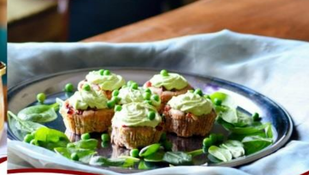
Suitsusüsingiga odrajahukarask koos kokeva hernevahuga Kuremaa lossi moodi.

Rukis ja oder on olnud Eestis kõige olulisemad teraviljad. Kui rukis oli keskajal Liivimaa peamine eksporditav, siis otra kasutati eelkõige kohapeal õlle pruulimiseks ja toiduks. Odrajahu tarvitati nii karaskite küpsetamiseks kui leivatainasse lisamiseks, kui rukkijahuga oli kitsas käes, kruupidest ja tangudest keedeti putru ning suppi.