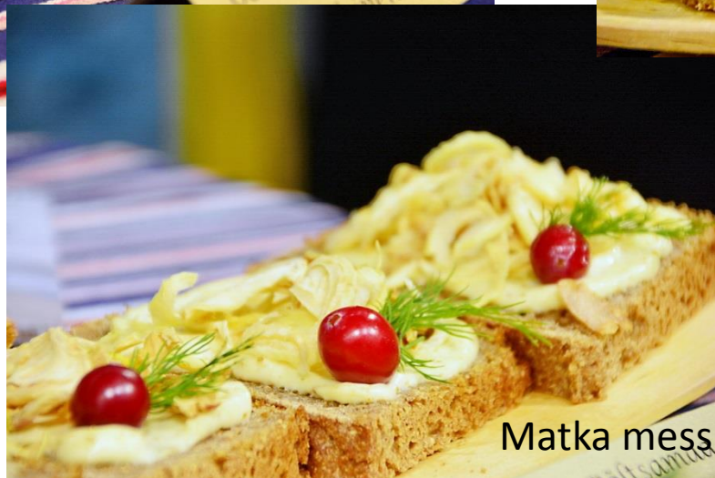
Matka mess Helsinkis, 2016