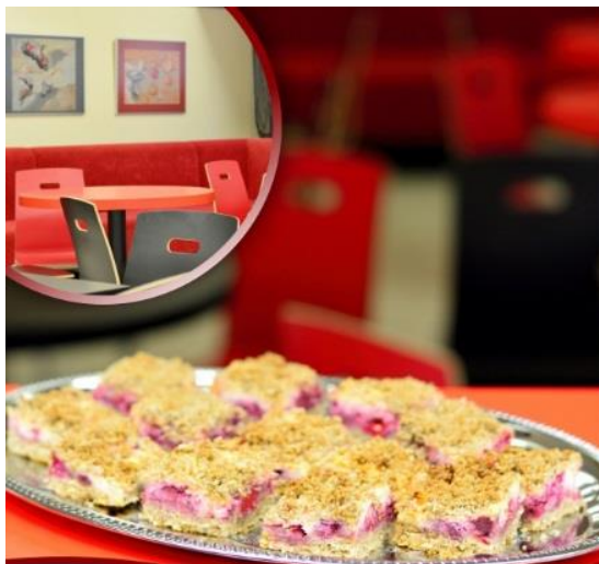
Jõgeva kohviku näkkkook ühendab rukkiliva soojuse ja põliseselise suve.

- Jõgevamaa tutvustamine läbi siin valmistatava toidu: